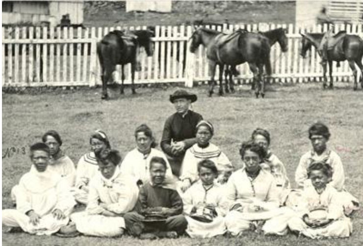
Damiaan en het meisjeskoor op Molokai, 1878

Zijn gekke kwetsbaarheid maakte hem creatief in alledaagse, kleine goedheid. Hij at met zijn zieke vrienden uit dezelfde kom en dronk uit dezelfde beker als teken dat hij één van hen wilde zijn. Telkens weer luisterde hij naar hun verhalen en sprak hen woorden van bemoediging en troost in. Ook de meest ontspoorde, die moreel slachtoffer werden van hun ziekte, liet hij niet in de steek. Hij vond het onverdraaglijk dat mensen, ook degenen die het meest 'aan de