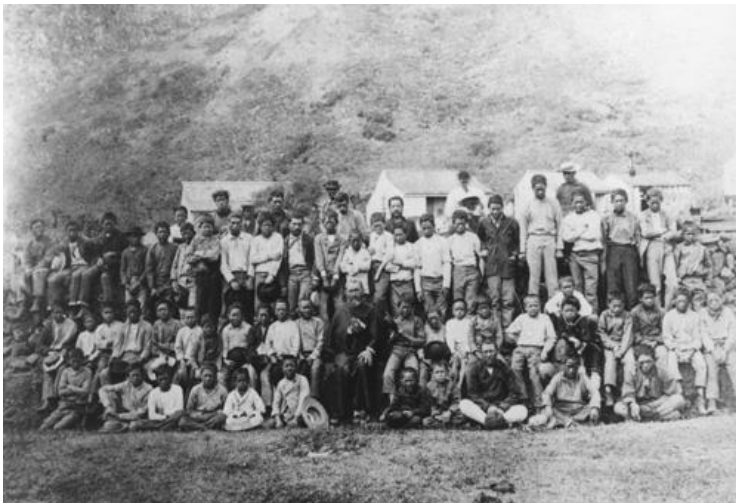
Damiaan en de weesjongens op Molokai, 1889

De kleine goedheid is het wonder van het menselijke in de mens. Sterker nog, zij is de vonk van het goddelijke, de Oneindige, in de mens. Of, in christelijke termen, de Geest van God die als liefde in ons hart is uitgestort (Rom 5,5). Is dit niet het diepste geheim, de 'ziel van de ziel' van Damiaan? Er wordt van hem gezegd dat hij in zijn inzet voor zijn medemensen gedreven was door zijn geloof. Geen abstract geloof in waarheden. Wel een concreet geloof in Iemand die Liefde is. Geloof als overgave aan Gods liefde, die mensen tot in lijf en leden bezielt om de afgezonderde (gevangen) ander nabij te zijn. Ook al is de kleine goedheid weerloos tegen de machten van het kwaad van de uitsluiting en brengt ze geen finale overwinning op het kwade,