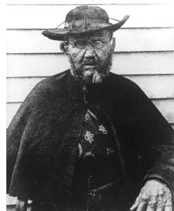
Damiaan op Molokai, 1889

Damiaan mag met recht en reden een belichaming van zo'n 'individueel geweten' genoemd worden. Door met de verstotenen samen te leven, zag hij wat de politieke en religieuze instanties niet zagen, namelijk de tranen van de unieke gekwetste en kwetsbare anderen. Daarom, zelfs in de beste en meest rechtvaardige organisaties kan niets het individuele geweten van de 'kwetsbare zielen' vervangen. Daarom kon geen enkele externe aanpak het individuele geweten van Damiaan, de kwetsbare ziel, vervangen, want hij alleen – mens met de mensen op Molokai, geen buitenstaander – kon zien wat er echt nodig was. Niets kan de individuele goedheid van mens tot mens vervangen, ook geen enkele