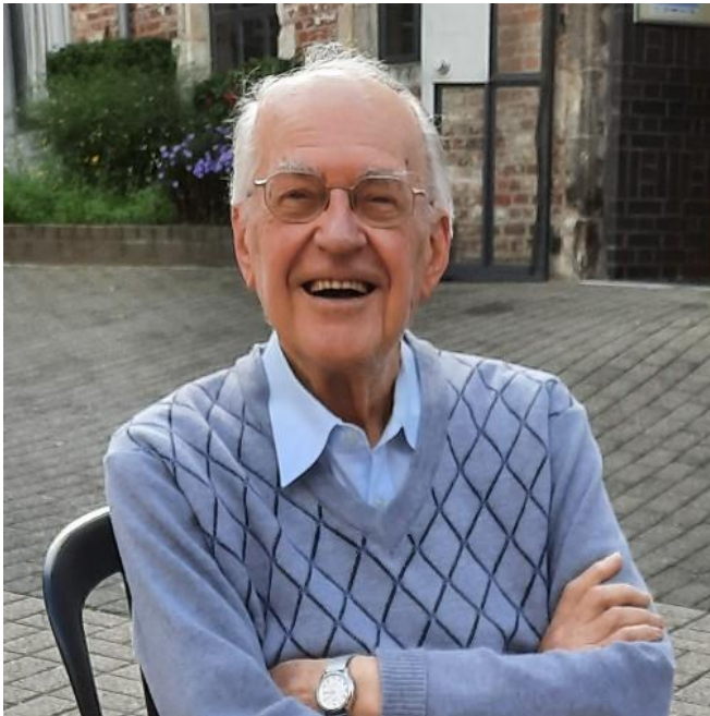
Met dank aan Wim Obbels en Rigo Peeters

In 1989 organiseerde René als provinciale overste mee de herdenking van de honderdste verjaardag van Damiaans overlijden met een groot congres in Brussel, de viering op de Heizel, de plechtigheden in Tremelo. Het enthousiasme van het brede publiek voor de viering in 1989, de zaligverklaring in 1995, de verkiezing tot Grootste Belg in 2005 en de heiligverklaring in 2009 was voor René een bevestiging van Damiaans blijvende relevantie en een aanmoediging om zijn actuele boodschap gestalte te geven in het leven van elke dag.